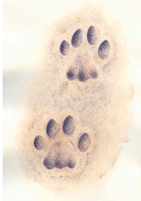
Tabla 1. Tamaño de la huellas de lince ibérico adulto ( Lynx pardinus ) en los Parques Nacional y Natural de Doñana, Huelva, medidas sobre rastros de 20 individuos diferentes.

Las huellas de los lince dejan una almohadilla plantar y cuatro almohadillas digitales bien marcadas. La almohadilla plantar tiene una forma más o menos trapezoidal y en la parte proximal tiene un trilobulado más marcado en la huella del pie que en la de la mano. ¡Son idénticas a las de un gato pero grandes!. Pueden confundirse con las de un gato montés. Las huellas digitales son grandes, alargadas y ligeramente apuntadas. Las medidas de las huellas en arena de mano y pie aparecen en la siguiente tabla.